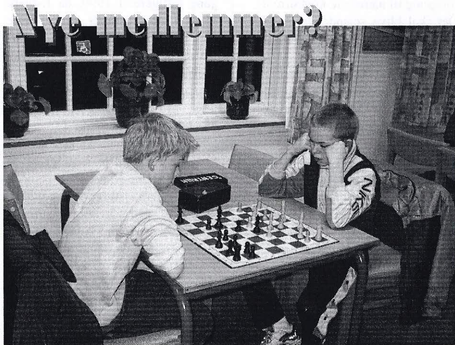
d. 18/3 var der et sandt ryk ind af måske kommende medlemmer (3 stks) Måske er det et par fremtidige stormestre der duellerer her.